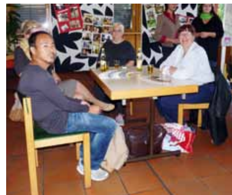
Ausgezogen: Teilnehmer des ABW informierten aus erster Hand.

ße stellte noris inklusion auch das Ambulant Betreute Wohnen (ABW) vor, welches bereits 110 Menschen die Möglichkeit bietet, ein individuelles Leben zu führen. Nahezu einhundert Anwesende zeigten an diesem Abend, wie groß das Interesse und der Bedarf an stationären und ambulanten Betreuungsangeboten sind.