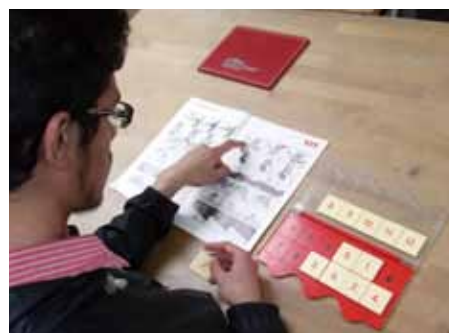
Selbstbestimmt: Jeder legt sein individuelles Lerntempo selbst fest.

Das selbständige Lernen steht hier im Vordergrund und die Teilnehmer entscheiden frei, an welchen Themen sie arbeiten möchten. Dadurch entstehen positive Lernerfahrungen, die das Selbstbewusstsein stärken, um sich nach und nach an immer schwierigere Themen heranzuwagen.