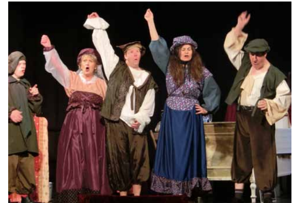
Jetzt ist Schluss: Die Pariser gehen auf die Barrikaden.

absurden Steuern. Filou, Sohn eines Bistrosbesitzers ist in Gourmandine, Tochter des benachbarten Bildhauers Trottoir verliebt. Doch die beiden Familien liegen im Streit: Der Platz ist klein. Das Geld ist knapp und die Liebe der beiden jungen Menschen