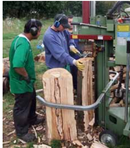
Harte Arbeit: Auch in die Brennholzfertigung schnupperten die Teilnehmer rein.

Zusammen mit dem Bildungsleiter unterstützten die Teilnehmer die jeweiligen Produktionsgruppen bei ihrer täglichen Arbeit und hatten damit ausreichend Gelegenheit den Arbeitsalltag der verschiedenen Gruppen kennenzulernen.