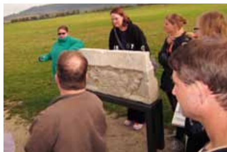
Zeitreise: Gemeinsam erkundete die Gruppe den Römerpark Ruffenhofen

Im Herbst 2013 lud die Firma MID Klienten aus dem Ambulant Betreuten Wohnen (ABW) zu einem gemein- samen Tagesausflug ein. Nach einem gemütlichen Frühstück im Werk Süd von noris inklusion zeigten die Teilnehmer den Firmenvertretern stolz ihre Arbeitsplätze. Im Anschluss ging es gemeinsam zum Limesseum