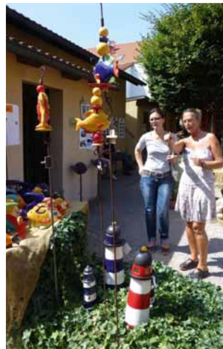
Vor Ort konnten sich Besucher von der Handwerkskunst überzeugen

gen: Von der ersten Kleingruppe in Eibach 1993 und über die Ladeneröffnung 1994 bis zur heutigen Töpferei. Das Auftragsvolumen wächst stetig und liefert damit einen Beweis für den Erfolg!