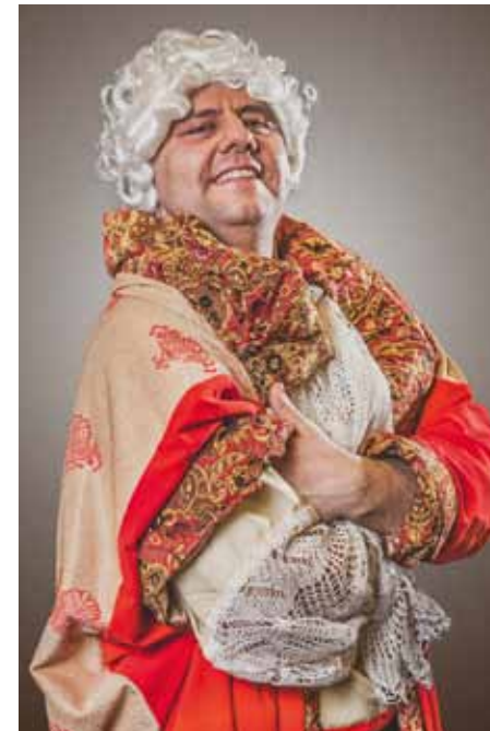
Lebenslustig: Ludwig der Keusche macht seinem Namen keine Ehre.

Wenn die Pariser platzen“ spielt zur Zeit des Rokkoko. Während die Oberen in Saus und Braus leben und König Ludwig der Keusche sich mehr um das weibliche Geschlecht als seine Staatsgeschäfte kümmert, darbt das Volk geplagt von roher Gewalt und