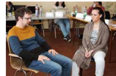
Ausprobiert: In Rollenspielen setzten die Teilnehmer das Modell in die Praxis um.