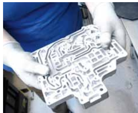
Notwendig: Die Platten sind wichtiger Bestandteil von Doppelkupplungsgetrieben.

werden. Diese Platten sind Bestandteil der Steuerung für Doppelkupplungsgetriebe in Personenkraftwagen diverser deutscher Autohersteller.