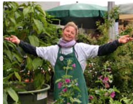
Hereinspaziert: Gäste wurden mit offenen Armen empfangen.

Seit 20 Jahren bietet das Wohnheim Montessoristraße von noris inklusion behinderten Menschen die Möglichkeit ein selbstbestimmtes Leben zu führen. Ein Grund zum Feiern! Bei schönstem Sommerwetter führte der Weg in die „Monte“ an wundervoll verzierten Laternen vorbei und prächtig blühenden Blumenbeeten entlang bis in den Garten, aus dem fröhliches Stimmengewirr und fetzige Musiktöne. Bewohner und