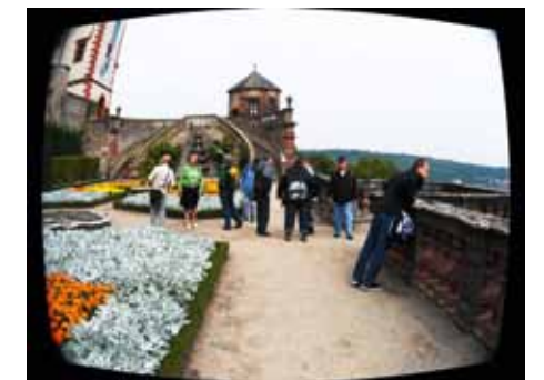
Ungewöhnliche Aussicht: Von der Festung Marienberg hatte die Gruppe einen tollen Ausblick auf Würzburg.

barem Wetter im schönen Garten des Wohnheimes in der Montessoristraße ein gemeinsames Grillfest mit jeder Menge guter Laune und ausgelassener Stimmung. Am 27.08.2013 wurde dann bei einem gemeinsamen Ausflug die Stadt Würzburg erobert. Allen war schnell klar: Das ist schön, das macht Spaß, das wird bald wieder gemacht.