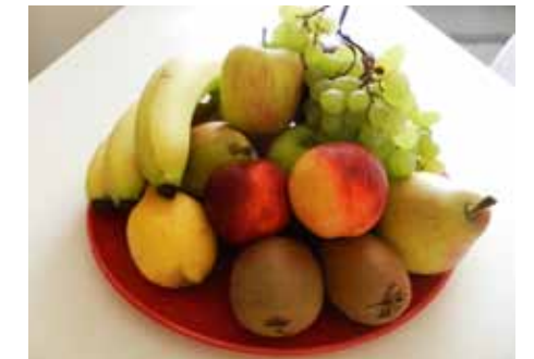
Gesund: Ein Großteil unsere Nahrung sollte aus Obst und Gemüse bestehen.

Einkaufsverhalten nachhaltig und lindert damit Übergewicht, Diabetes oder Bluthochdruck. Trotz gesunder Ernährung kommt der Geschmack dabei nie zu kurz und Essenswünsche werden weiterhin erfüllt. Schließlich machen die Bewohner keine Diät, sondern stellen ihre Ernährung um. Und das mit Erfolg!