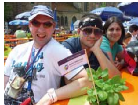
Gut Gelaunt: Die Stimmung unter den über 2000 Gästen war prächtig.

Verbesserung der Lebensqualität von Behinderten. Für kurzweilige, fetzige Unterhaltung sorgten die Blind Devilz – Musikgruppe der Nürnberger Wohn- und Werkstätten, das Duo November und die B-Shakers.