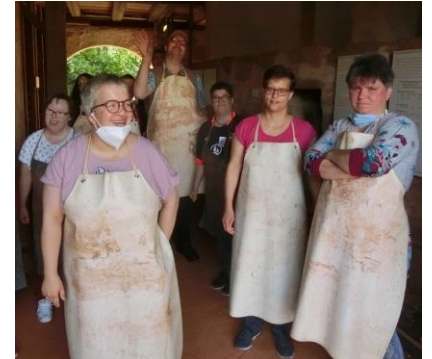
Fleißige Handwerker in Aktion